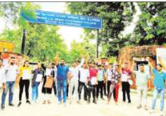
प्राचार्या से मिला तो उसे कोई संतोषजनक जवाब नहीं दिया गया। उन्होंने कहा कि कई बार छात्रों की शिकायत आती है कि दाखिले के नाम पर रिश्तत ली जा रही है लेकिन आश्रय वाली बात