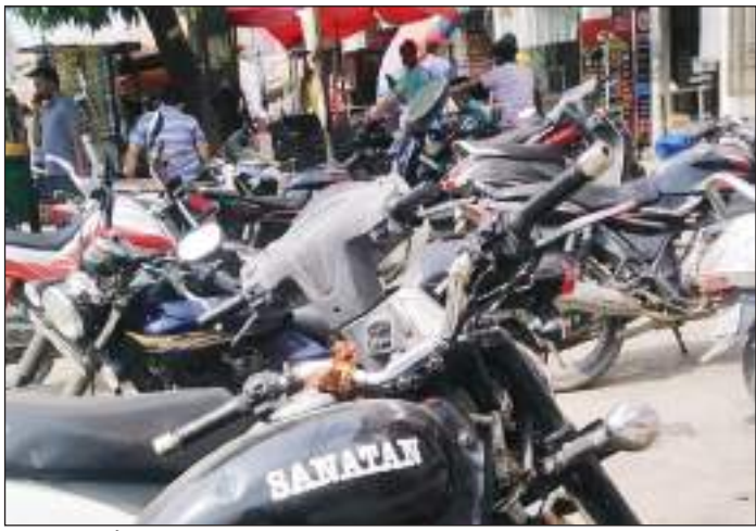
दिया जाता है। दुकानदारों की ग्राहकी पर भी पड़ा है खासा असर: इस मामले में

टीम एक्शन इंडिया/नई दिल्ली बुराड़ी विधानसभा क्षेत्र के अंतर्गत आने वाले संतनगर की मैन मार्किट काफी लंबे समय से पार्किंग की समस्या से जूझ रही है। यह समस्या अब विकराल रूप लेती जा रही है, जिसके चलते लोगों को असुविधा का सामना करना पड़ रहा है। आपको बता दें कि आलम यह है कि यदि कोई व्यक्ति खरीदारी करने के लिए आता है तो उसे अपना वाहन खड़ा करने के लिए कोई भी उपयुक्त स्थान नहीं मिलता है, जिसके चलते मजबूरी में उसे सड़क के किनारे इधर-उधर ही गाड़ी खड़ी करनी पड़ती है, जिसके चलते ट्रैफिक जाम तो होता ही है बल्कि अवैध पार्किंग के चक्कर में यातायात पुलिस द्वारा भारी भरकम चालान काटकर उसके हाथ में थमा