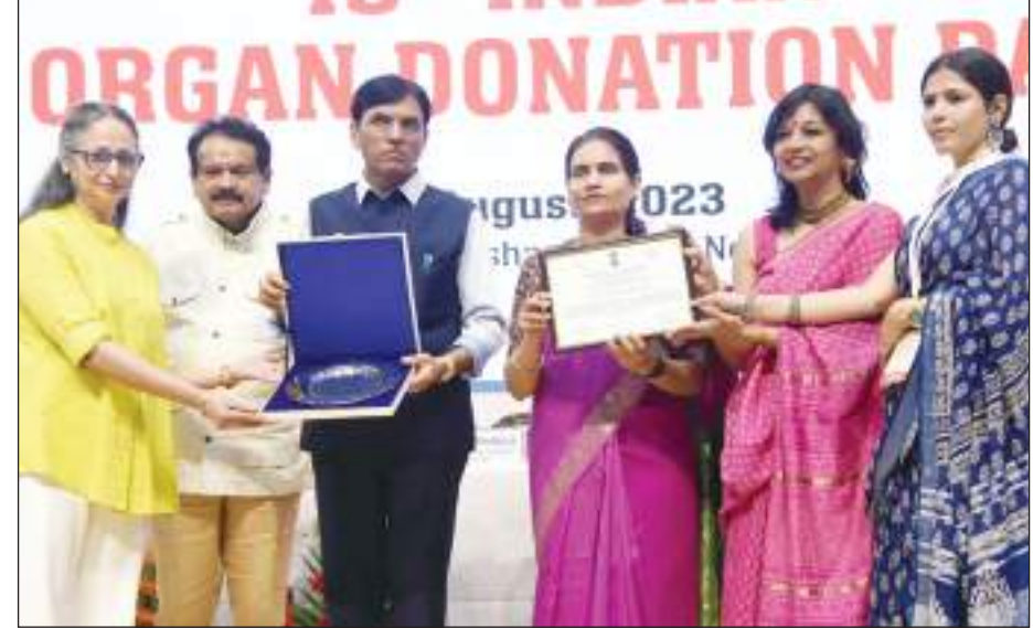
13वें ऑर्गन डोनेशन डे पर आयोजित कार्यक्रम में केंद्रीय स्वास्थ्य मंत्री मनसुख मंडाविया शामिल हुए।