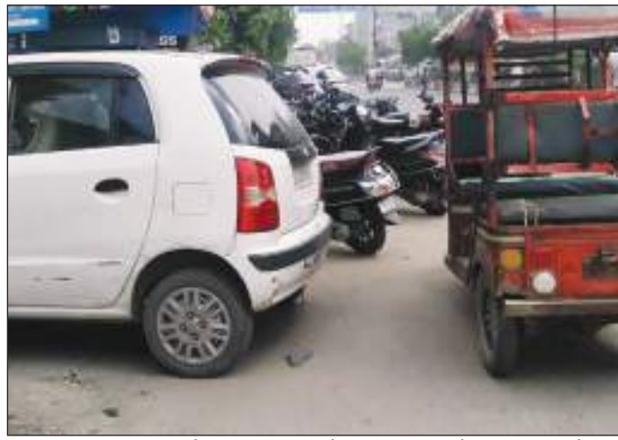
का सामना करना पड़ता है जिसके चलते ग्राहकों को मजबूरी में सड़क पर ही अपनी गाड़ी खड़ी करनी पड़ती

दुकानदारों ने कहा कि जब भी कोई ग्राहक खरीदारी करने के लिए आता है तो उसे वाहन खड़ा करने की समस्या