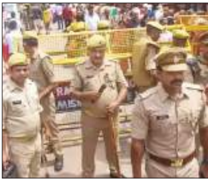
इलाहाबाद हाईकोर्ट ने गुरुवार को ज्ञानवापी परिसर के एएसआई सर्वे की इजाजत दे दी। इसके बाद ज्ञानवापी परिसर की सुरक्षा बढ़ा दी गई।